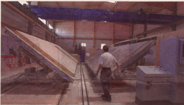
Die neue Linie erlaubt auch die Verarbeitung größerer Teile in besserer Qualität.

preisen Rechnung getragen. Letztlich will die Gebrüder Friedrichson GmbH aber